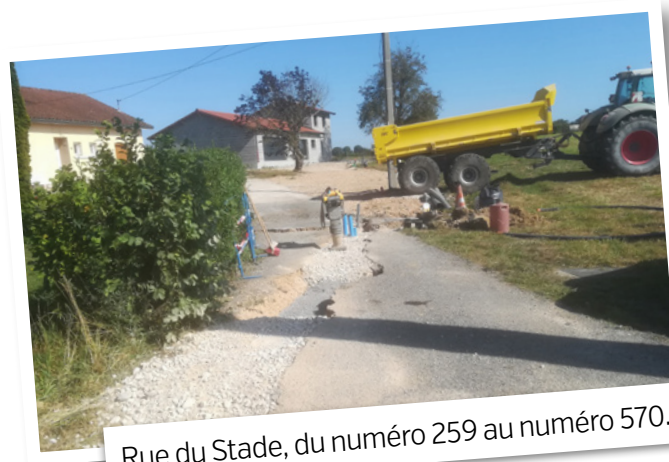
Rue du Stade, du numéro 259 au numéro 570.