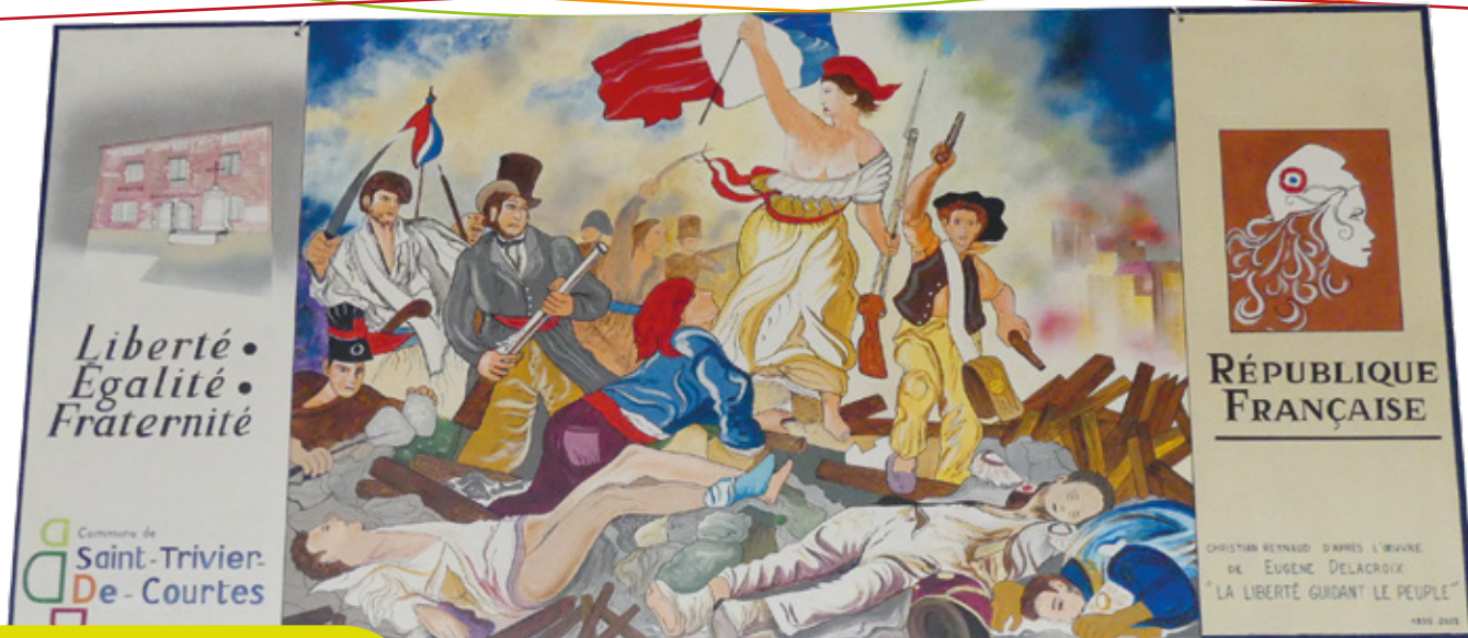
Réalisation par notre artiste peintre Christian REYNAUD