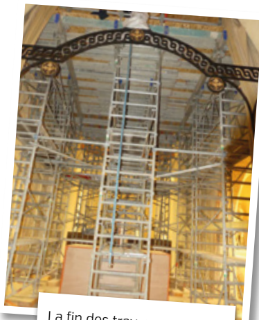
La fin des travaux est prévue pour mi-novembre.

Une fois l'accès au clocher sécurisé, le diagnostic des réparations à effectuer va pouvoir commencer. Ce diagnostic se fera sur une période de quatre mois. Ensuite aura lieu l'appel d'offre. Le début des travaux de remise en état est prévu pour septembre 2023 pour une livraison été 2024.